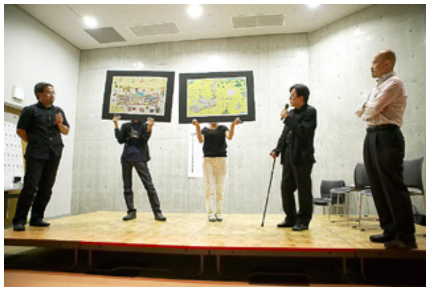
CCTA 2007 表彰式風景 (丸亀町商店街「レッツホール」)

上記の8部門で作品募集し展示いたします。会員による投票によってグランプリ、各部門賞が決定します。